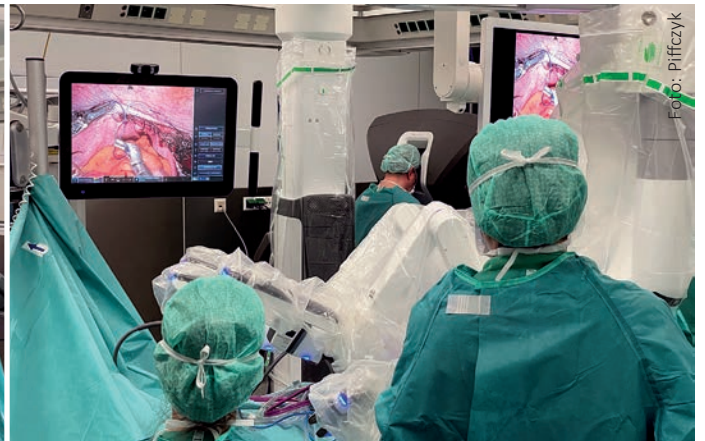
Die ersten Einsätze mit dem OP-System

Eine wesentliche Weiterentwicklung in der minimal-invasiven Chirurgie wurde durch die Entwicklung und Implementierung robotischer Operationssysteme erreicht. Dabei handelt es sich um Systeme, die den Operateur beim Erreichen des optimalen